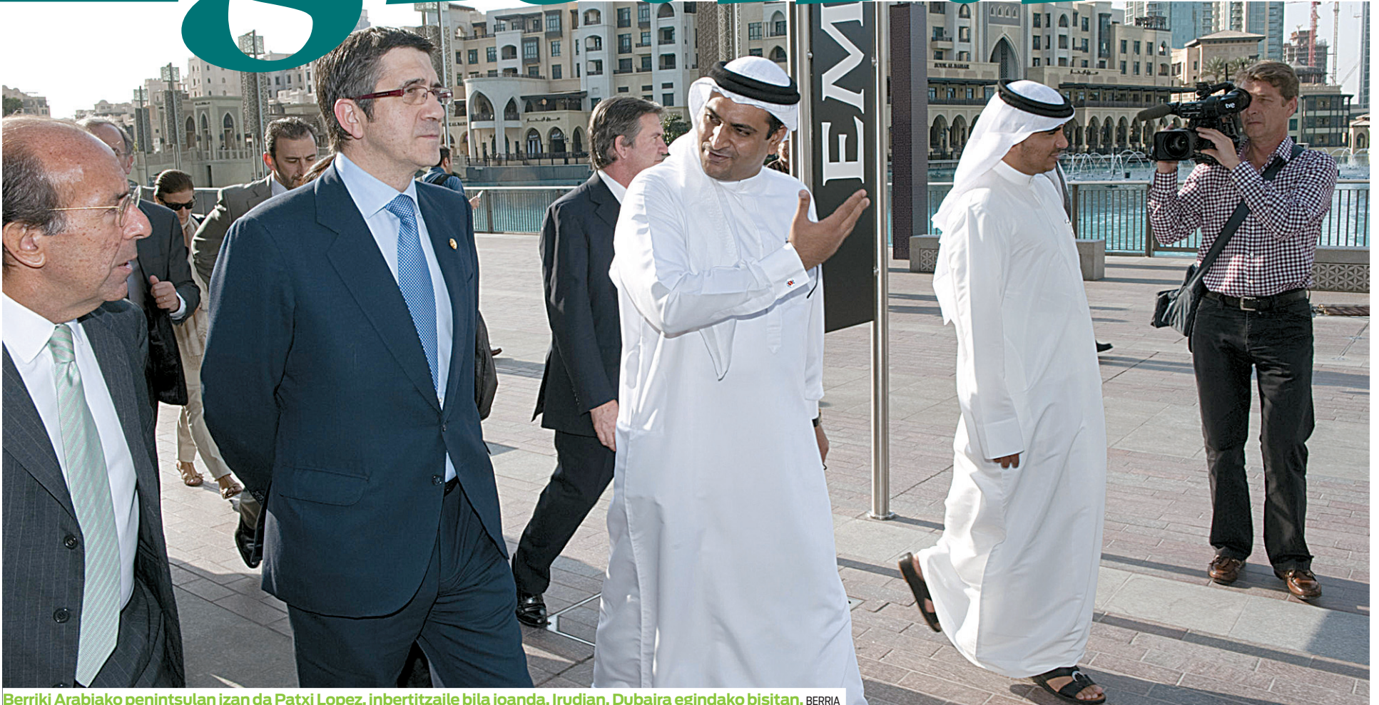
Berri Arabiako penintsulan izan da Patxi Lopez, inbertitzaile bila joanda. Irudian, Dubaira egindako bisitan.